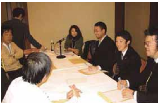
▶活発な意見交流をする参加者達

ルすることが重要。子育てをどのようにして良いのかわからない、という親も多い中、幼稚園は地域の子育てサポートという役割も求められる。それらをふまえ、自分の園のファンをより多く作っていくことが大切なのではないか。とまとめがあった。多くの情報を耳にすることとなり、後継者達はとても熱心に参加していた。時間が足りない程であったが、ここで得た情報はこれからの幼稚園のあり方へのヒントとなる研修であった。(文責・西鎌倉幼稚園 福田光葉)