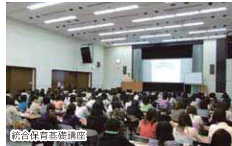
統合保育基礎講座

免許の更新制や学校評価のチェックリストなど、決してあなたがかいと云えない制度が義務化されました。教育の基本は、互いに信頼し合うことをベースにしないといけないと思うのですが、これらの制度は疑いの視点から出てきた制度のような気がします。 だからこそ、実際に研修を行うときには参加した先生一人ひとりに響く生き生きとした研修が行われなければなりません。 研究研修の核には子ども達に幸せになってももらいたい！ そのためには、向上心を持ち続ける素晴らしい保育者になってほしい！という主催者の熱意が必要で。 新しい制度の中でも、『心が響き合う幼稚園教育』を五年間の大会テーマに掲げ、情熱を持ちながら二十一年度も、研究部員三十名で研究部活動を進めてまいります。