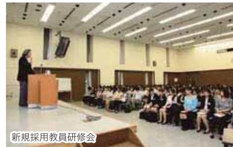
新規採用教員研修会