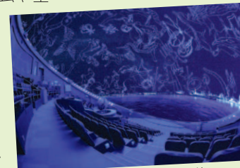
はまぎん こども宇宙科学館

わに 『無料や安価だと子育て世代に優しいですよ！私がよくリピートするのは洋光台にある、はまぎん こども宇宙科学館です。プラネタリウムや室