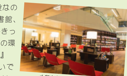
大和市文化創造拠点シリウス

てら 『そうですね、子連れで行って良かったスポットは大和市文化創造拠点シリウスです。大和駅から徒歩3分の好立